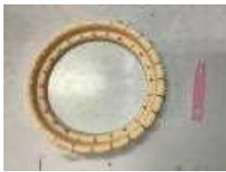
用意するもの コースターメーカー(セリアで購入)