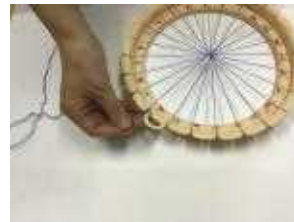
①軸糸を放射状にかける。