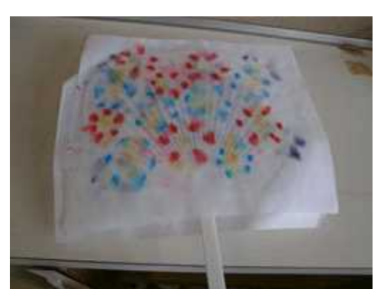
⑤うちわの骨を置き、両面かぶせて押さえ乾かす