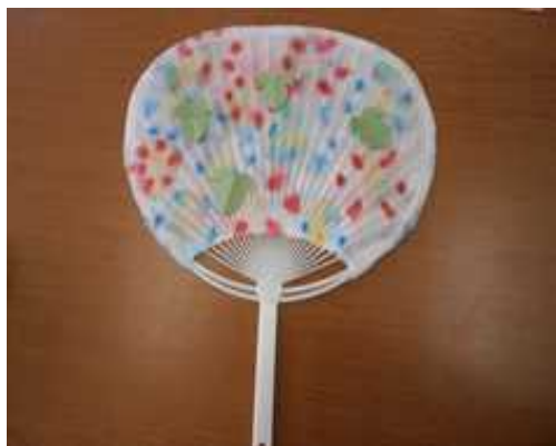
① 切って作った朝顔の葉を貼り完成