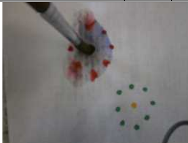
②中心に水を垂らして・・・