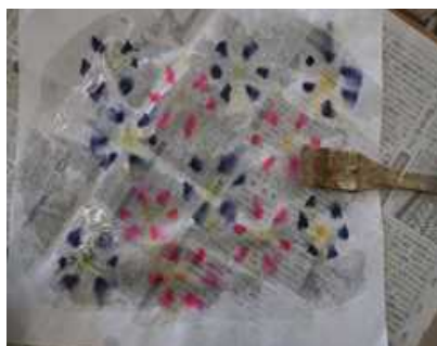
④水のを薄めて塗る（2枚作る）