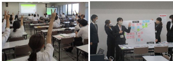
初任者・初期研修講座の様子

学校教育活動を進める上で基本的なことや指導のヒント・コツ等を具体的に記した『教職員のための研修ハンドブック～新規採用者バージョン～』を作成し、初任者及び新規採用者に配布しています。