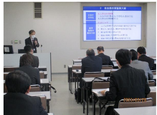
新任校長内定者研修会