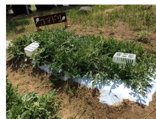
こまどりファーム