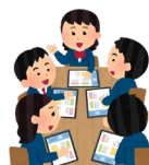
1人1台学習用端末を 活用した学びの推進