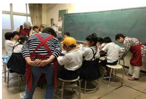
図 4 放課後の体験活動

各地域においては、この事業により学校と地域が連携・協働し、豊かな教育活動が展開されている。