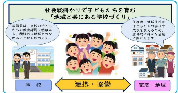
図1 地域と共にある学校づくり

学校が抱える課題は複雑化・困難化しており、地域社会は、つながり・支え合いの希薄化等により、その地域の教育力が低下している。そのような中、社会的課題の解決を目指すとともに、「社会に開かれた教育課程」の実現に向けた基盤として、学校と地域が連携・協働し、地域全体で未来を担う子どもたちの成長を支えて、社会総掛かりで子どもたちに対応する必要がある。