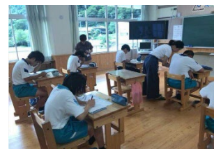
図 3 教科学習の支援

平成 25 年度から、県内の公立幼稚園・認定こども園、小学校、中学校において、これまでの学校と地域が連携した取組の成果を踏まえ、支援から協働へと発展させた新たな仕組みづくりを目指し、国の補助事業を活用した「奈良県学校・地域パートナーシップ事業」を行っている。取組としては、学習支援活動、環境整備活動、登下校の安全見守り活動、学校行事支援、特別活動の支援等が行われ、これらの活動を通じて、地域教育力の向上も図っている。