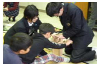
図 5 県立学校の取組

県立学校では、平成 25 年度から「地域と共にある学校づくり」を推進している。「県立学校による地域との協働推進事業」においては、「社会に開かれた教育課程の実現」の理念に基づき、児童生徒が主体的に学ぶ意識を育むことを目的に、地域や社会との協働の下、生徒が主体的に参画する、教育課程に位置付けられた取組等への支援を行っている。