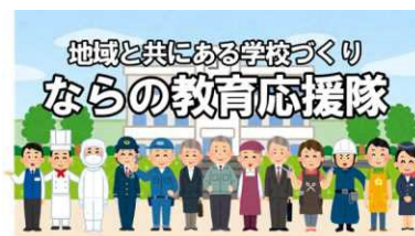
図6 ならの教育応援隊

人権・地域教育課Webサイトから「ならの教育応援隊」に登録された団体や企業の取組を検索し、つながることができる。