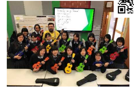
↑「音楽」の授業、ウクレレ演奏

17日間の日程でホームステイをしながら、オーストラリア・アデレードのハミルトン・セカンダリー・カレッジで語学研修を行いました。オーストラリアの先住民について学ぶ授業などを通して、オーストラリアの文化を吸収しました。