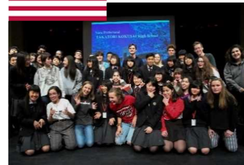
↑シェーカーハイツ高校にて