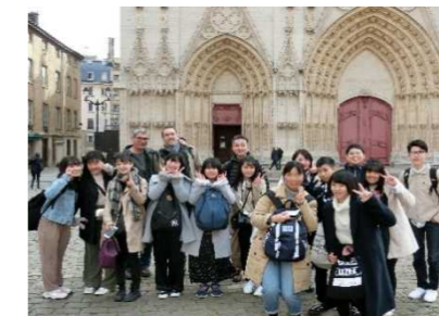
↑リヨンの歴史ある教会の前で