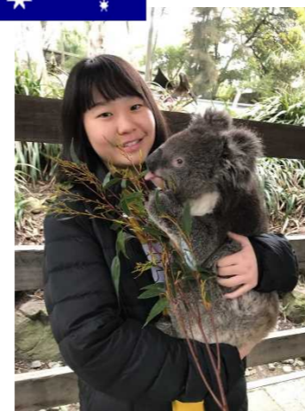
↑コアラを抱っこしました