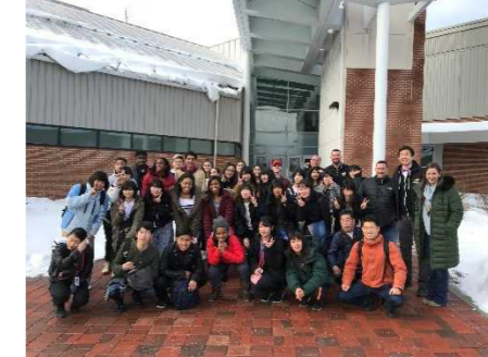
↑ビーチウッド高校にて