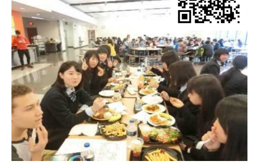
↑食堂でボリューム満点のランチ

17日間の日程でホームステイをしながらアメリカ・オハイオ州のクリーブランドにある姉妹校2校を訪問しました。学校での授業体験はもちろん、様々な校外活動などを行い、アメリカの文化に触れます。最後はロサンゼルス都市研修！ディズニーランドを朝から晩まで満喫しました。