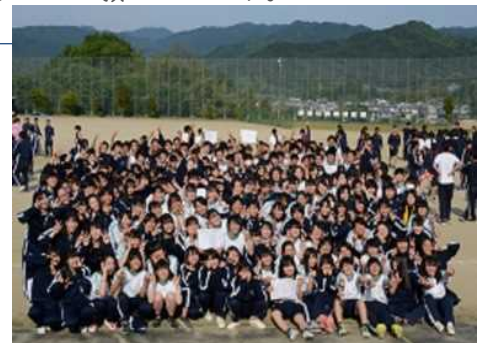
1年間よく頑張りました(^_^)

来年度は、進路決定という将来に直結する重大な覚悟を迫られる年になります。子ども親も教員もプレッシャーを感じる日々になるかと思いますが、より一層一つになって歩いていけますよう、引き続きご協力ください。