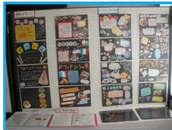
課題研究中間発表