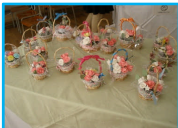
2年生展示シュガーデコレーション