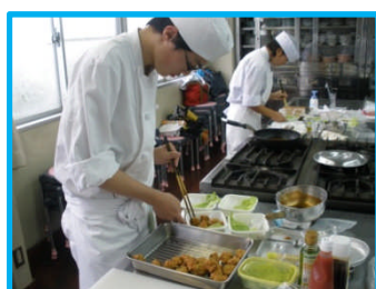
肉料理コンテスト

授業では…テーブルコーディネートの一つとしてフラワーアレンジメントをマイスターの方に教えていただいたり、包丁の研ぎ方などを教えていただきました。