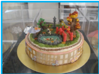
マジパンデコレーション