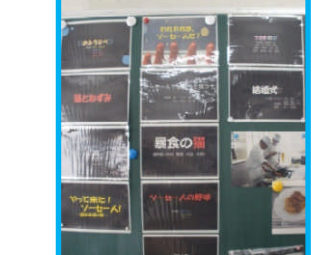
課題研究中間発表