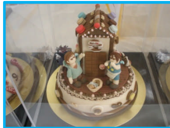
マジパンデコレーション