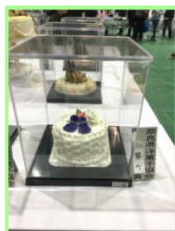
シュガーデコレーション