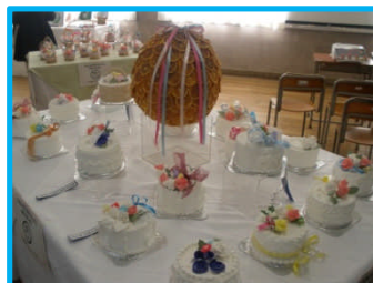
課題研究中間発表