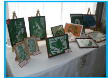
3年生展示 葉らん細工