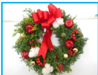
クリスマスリース