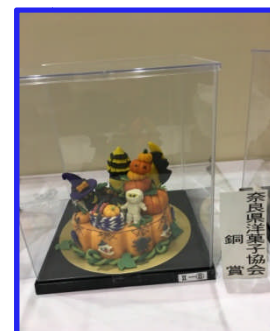
マジパンデコレーション