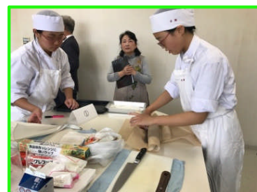
田原本町お料理コンテスト

みんな2学期よくがんばりました！寒いですが、風邪などひかず、欠席せずに補充授業を乗り切りましょう。また提出物・課題など、出し忘れのないよう気をつけること！ すべきことはしっかりやり、すっきりと新年を迎えましょう。