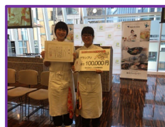
たまごにここ料理甲子園