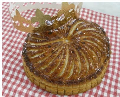
ガレット・デ・ロワ