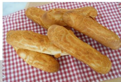
タイガーロール (クリームチーズ入り)