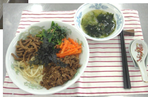
ビビンバ丼・わかめスープ