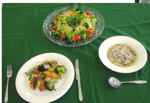
鶏もも肉のガーリックバター焼き クリスマスリースサラダ きのこのスープ