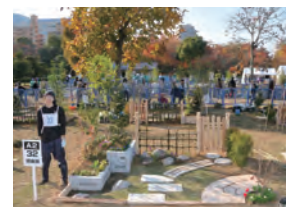
平成 25 年度 敢闘賞