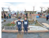
平成26年度 銅賞(高校生日本一)