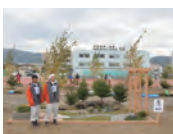
平成24年度 銅賞・学生日本一