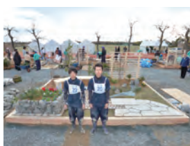
平成 26 年度 銅賞(高校生日本一)