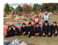
平成 28 年度 銀賞