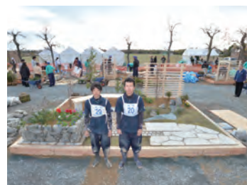
平成26年度 銅賞(高校生日本一)