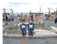
平成 26 年度 銅賞(高校生日本一)