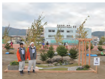
平成24年度 銅賞・学生日本一