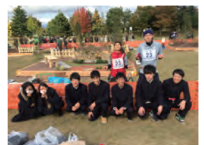
平成 28 年度 銀賞