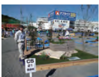
平成 23 年度 銀賞・学生日本一