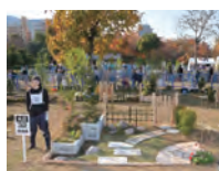
平成 25 年度 敢闘賞