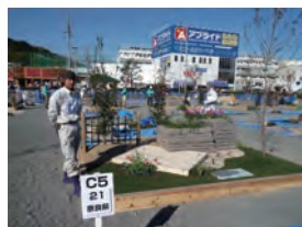
平成 23 年度 銀賞・学生日本一