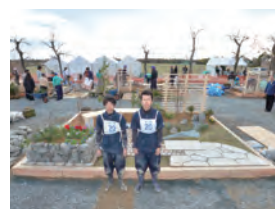
平成 26 年度 銅賞(高校生日本一)