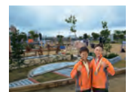
平成30年度 銀賞・学生日本一