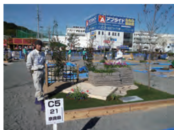
平成23年度 銀賞・学生日本一