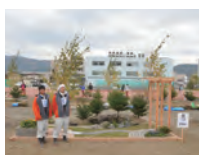
平成 24 年度 銅賞・学生日本一