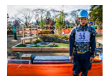
平成 29 年度 銀賞