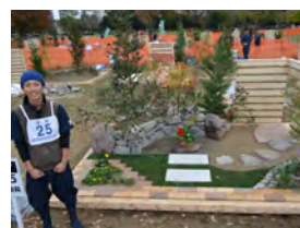
平成 27 年度 学生優秀賞