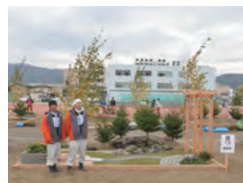
平成 24 年度 銅賞・学生日本一