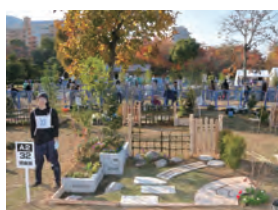
平成 25 年度 敢闘賞