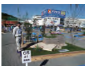
平成23年度 銀賞・学生日本一