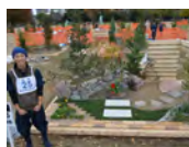
平成27年度 学生優秀賞