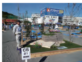
平成 23 年度 銀賞・学生日本一