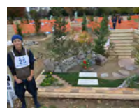
平成 27 年度 学生優秀賞