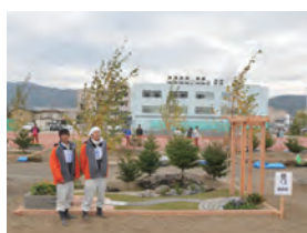
平成 24 年度 銅賞・学生日本一