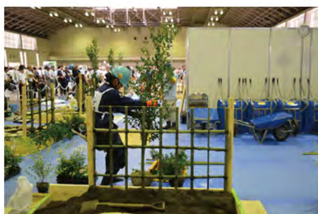
中野 太一 (銀賞)