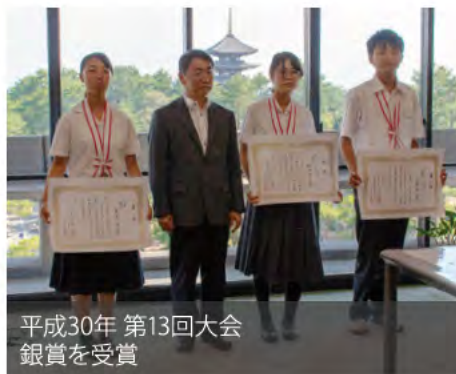
平成30年 第13回大会 銀賞を受賞

若年者ものづくり競技大会とは 若年者のものづくり技能に対する意識を高め、若年者に目標を付与し、技能を向上させることにより若年者の就業促進を図り、併せて若年技能者の裾野の拡大を図ることを目的として、20歳以下の若年者を対象として開催されています。 (主催：厚生労働省及び中央職業能力開発協会)