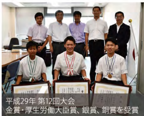
平成29年 第12回大会 金賞・厚生労働大臣賞、銀賞、銅賞を受賞