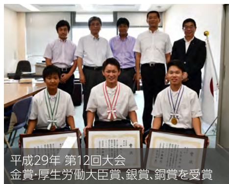
平成29年 第12回大会 金賞・厚生労働大臣賞、銀賞、銅賞を受賞