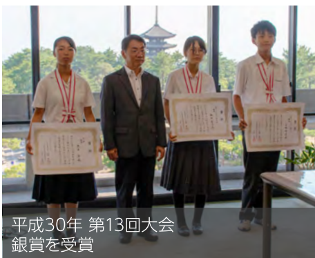
平成30年 第13回大会 銀賞を受賞