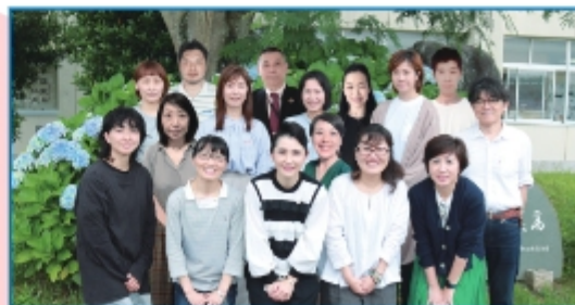
AKS (All Kokusai Support)