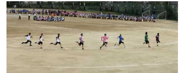
クラス対抗リレー