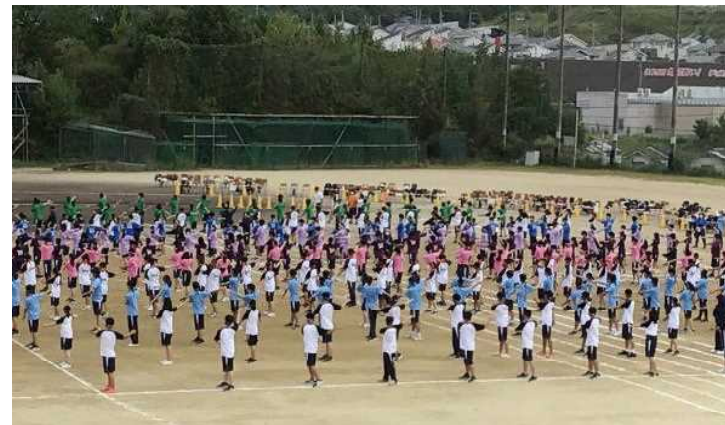
全員でラジオ体操

新型コロナウイルスの感染状況も落ち着きを見せ、本校も10月4日の週より通常登校に戻り、授業も50分校時となりました。しかしながら、体育大会を始めとする、9月、10月の学校行事を見ていただく機会がありませんでした。そこで、写真を数点載せることで紹介に換えさせていただきます。