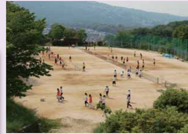
テニスコート 早朝から夕刻まで、若人約1,000人が、鍛練