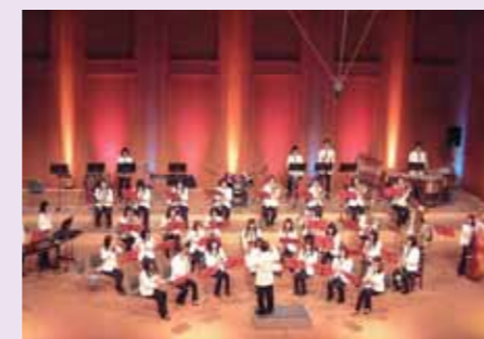
吹奏楽部定期演奏会