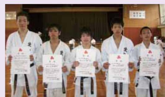
H21年8月、インターハイ(空手道部)