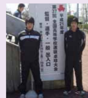
H22年3月、全国選抜卓球大会