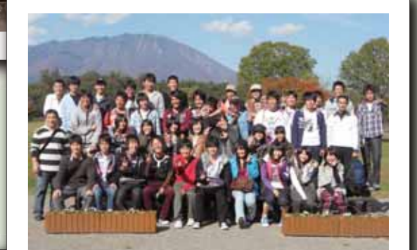
修学旅行(岩手県・小岩井農場)