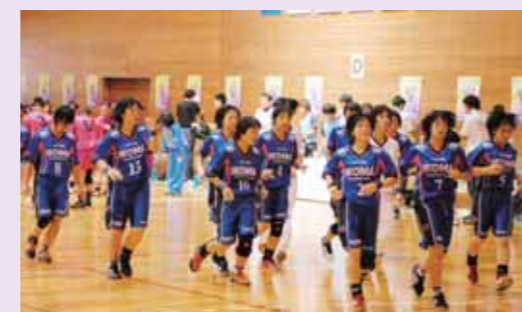
H22年8月、沖縄インターハイ(ハンドボール部)