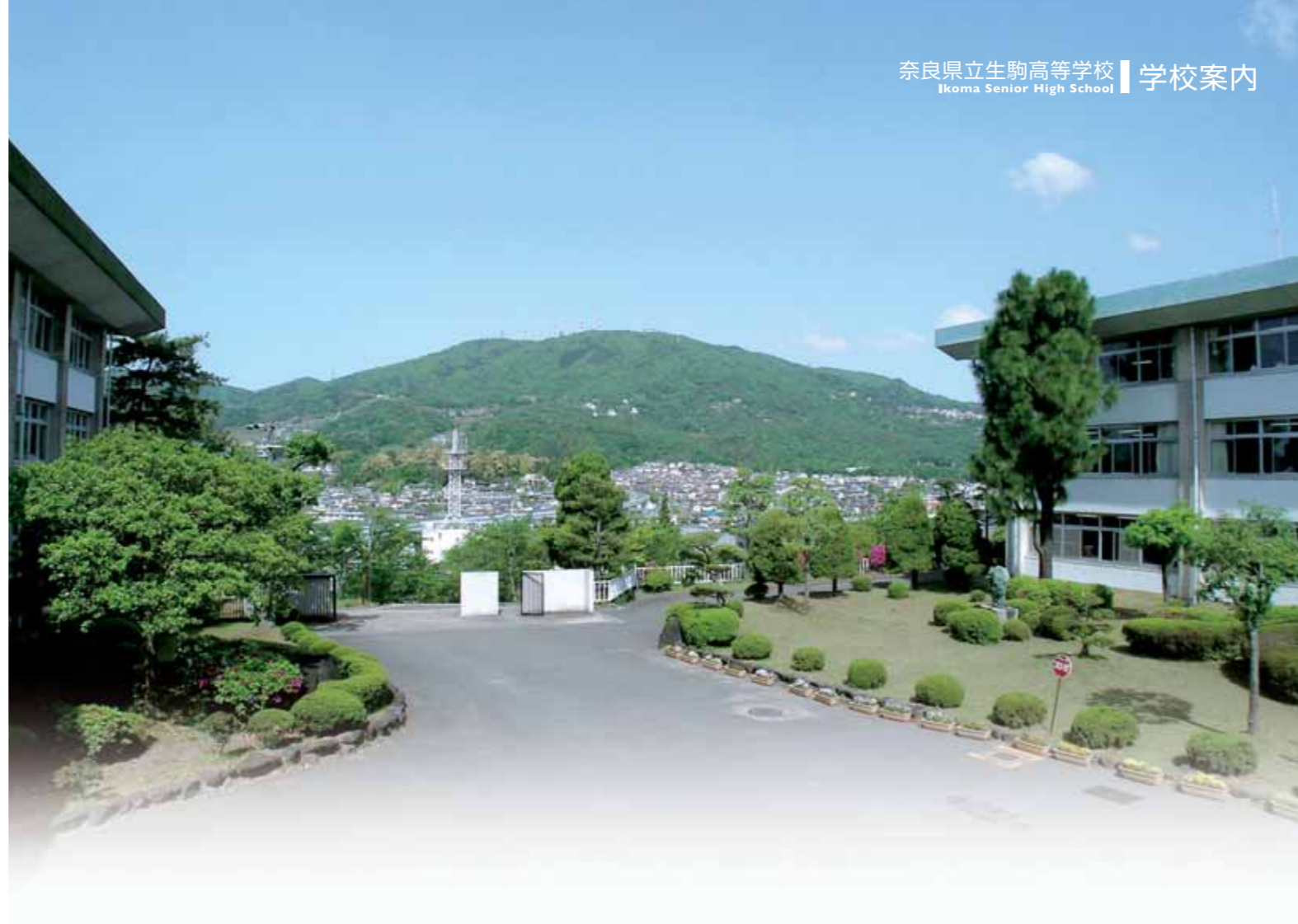
奈良県立生駒高等学校 | 学校案内