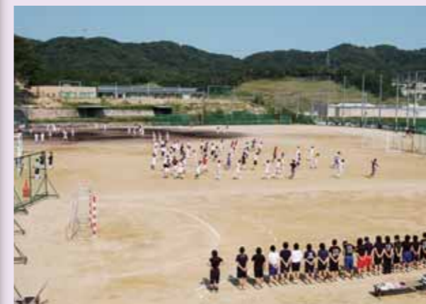
グラウンド かけ声・歓声 グラウンド・体育館等に弾け響く。 「生駒高で、思いっきり!」 輝け、青春の主人公たち。