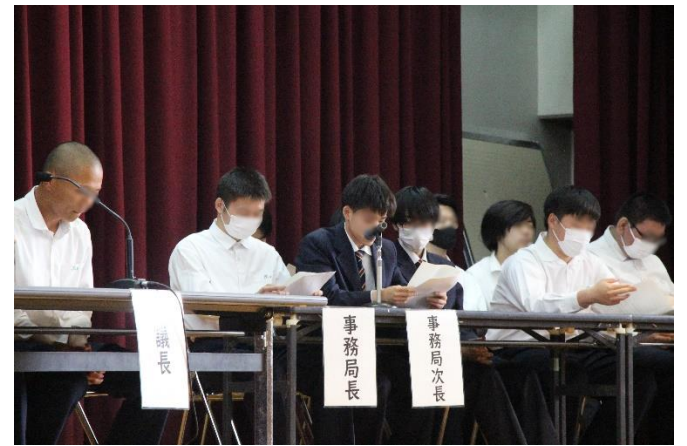
生徒会から議題がたくさんあがりました!