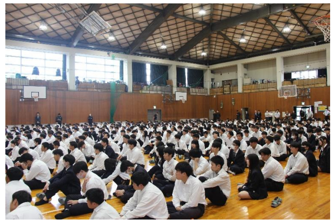
体育館一面に生徒がいる様子は圧巻でした!