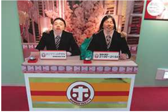
アナウンサーになってみました。