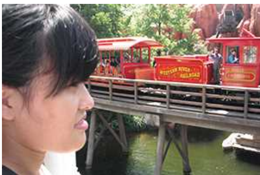
ウエスタンリバー鉄道通過中。