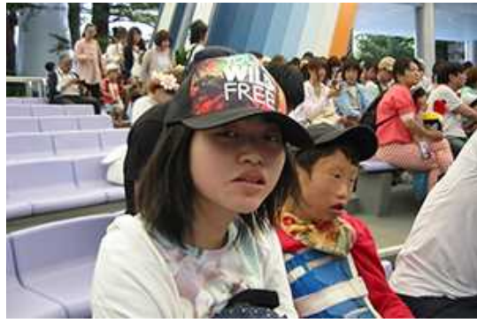
ショーはまだかな？