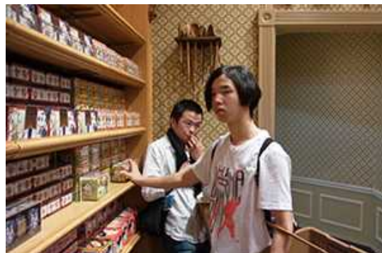
どれにしようかな。