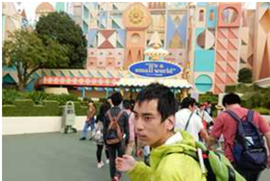
イツ・ア・スモール・ワールドに行こうよ。