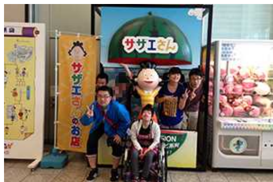
サザエさんのお店でポーズ。