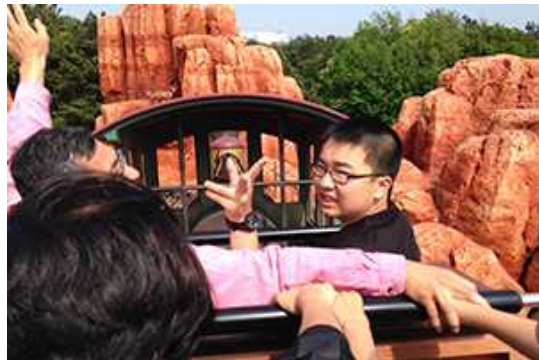
ビッグサンダーマウンテンサイコー！