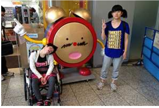
めざましくんと一緒にパチリ。