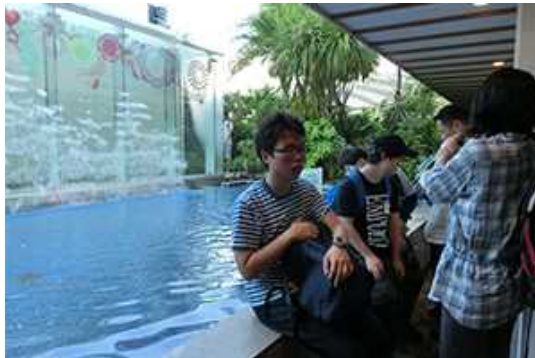
滝の前でちょっと休憩。