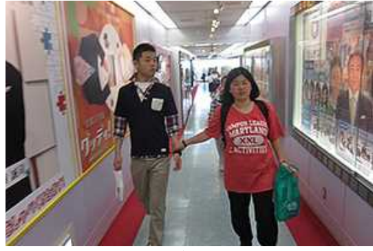
フジテレビの中です。