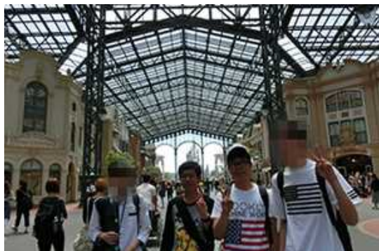
まずはワールドバザールで買い物だー！