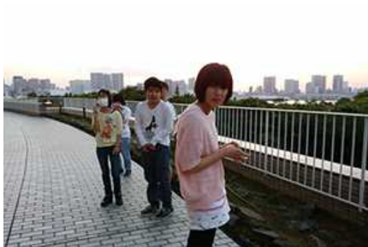
ホテルの外はきれいな夕焼けでした。