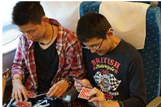
さあトランプしよう (^o^)