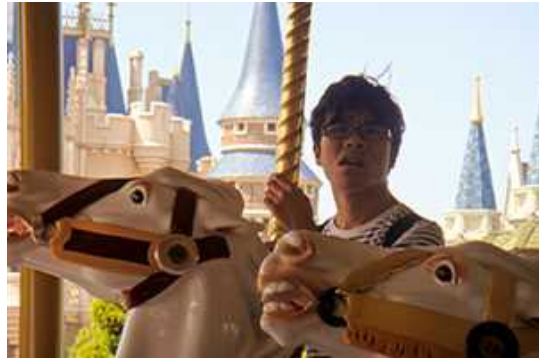
木馬の向こうにシンデレラ城！