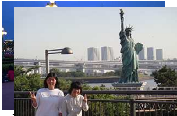
夜までお台場の『自由の女神像』です。