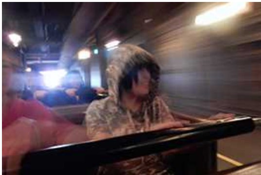
すごいスピードです！