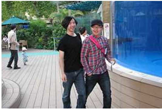
アシカのショーは、やってるかな？