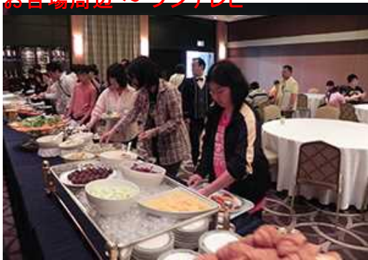
夜のリゾートにふつと。最後の朝食です。