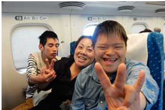
みんなでワイワイ！ たのしい!!