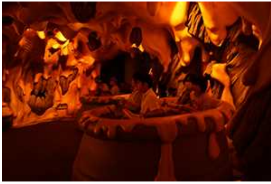
ピョンピョン弾んでます～。