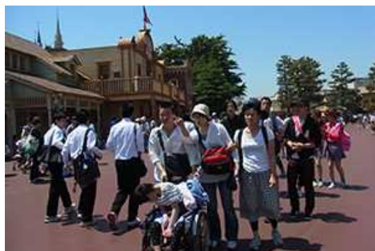
さて次は何に乗ろうか？