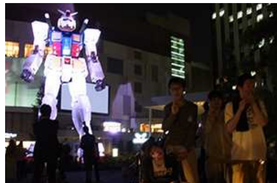
夜のガンダム！きれいでした。