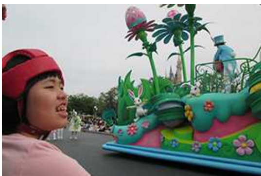
ステキなパレードねえ。