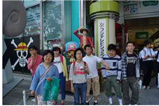
ルフィーの前で記念写真。