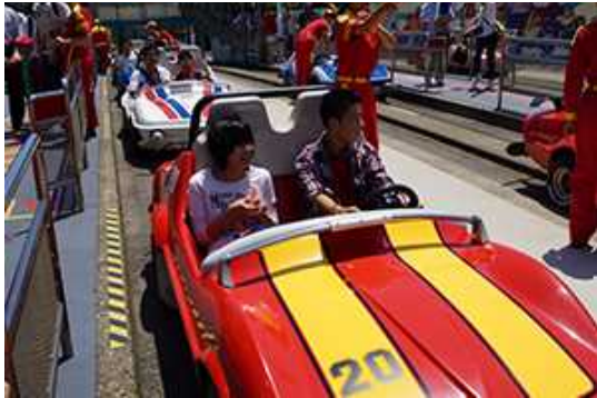
運転はまかせてね。