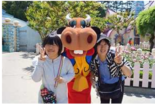
『クララベル・カウ』と出会いました。