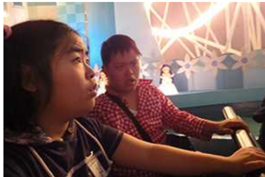
ファンタジーに酔いしれてます。