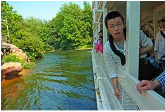
マーケットウエイン号で船旅！