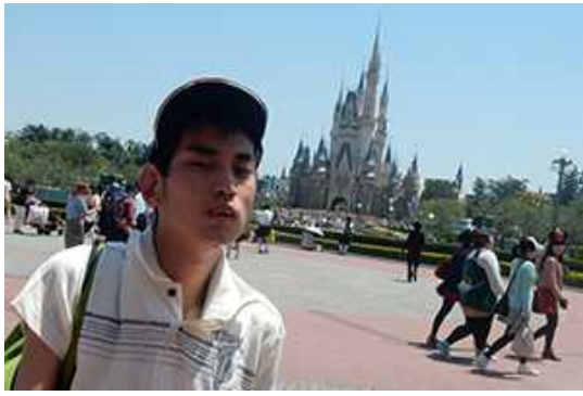
シンデレラ城が出迎えてくれました。