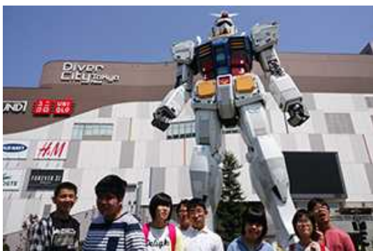
実物大ガンダムは大迫力！