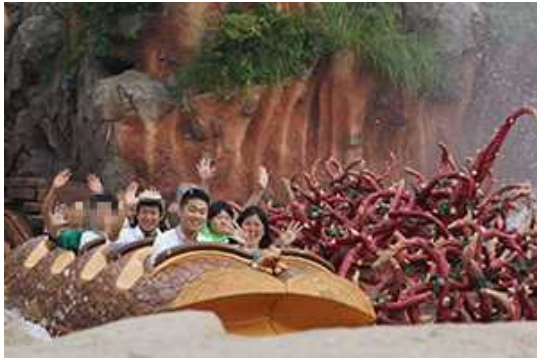
スプラッシュしました！