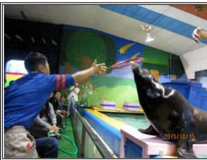
アシカに向かってそ〜れ!