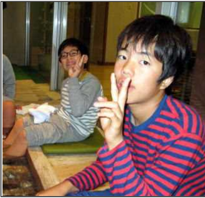
足湯でリラックス♪