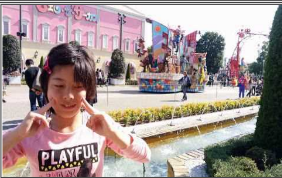
パレードを見ながら、はいチーズ！