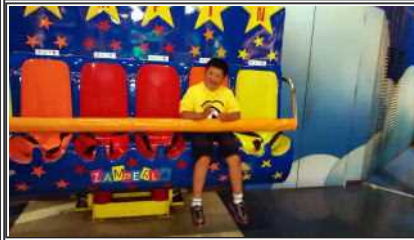
乗り物もたくさん乗ったよ♪