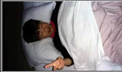
お部屋でゆっくり。明日も楽しむぞ～！！