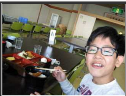
お昼ご飯も豪華です。