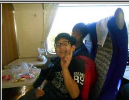
楽しかった修学旅行もおしまい。 いい思い出ができたよ♪

小学部6年生、伊勢志摩方面へ修学旅行へ行ってきました。 1日目は二見シーパラダイスで、海の生き物とふれ合い 遊覧船で鳥羽湾を巡りました。 宿舎に着いてからはおいしいご飯やカラオケ、お部屋でゆっくり。 2日目は志摩スペイン村でたくさんたくさん遊びました。 2日間、6年生みんなまで有意義な時間を過ごし楽しみました。