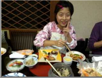
宿舎で晩ご飯。とってもおいしそう♪