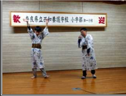
カラオケ大会！みんな～！盛り上がっていくぞ～！