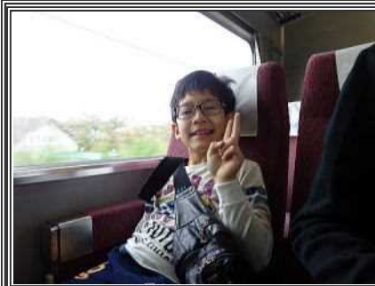
電車に乗って出発♪