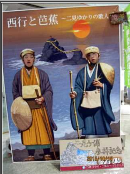
港にあったパネルで記念撮影♪