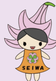
マスコットキャラクター ゆりっしー