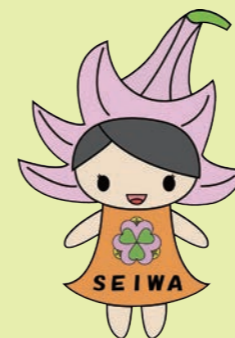
マスコットキャラクター ゆりっしー

ホームページ http://www.e-net.nara.jp/sns/seiwayougo/