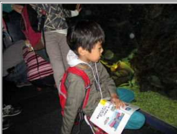
どんな魚がいるのかなあ?? わくわくするね。