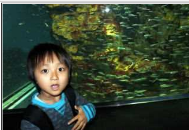
小さい魚がいっぱいいるよ！