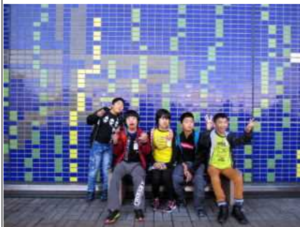
クラスで記念撮影♪ さあ、海遊館の中へ行くぞお～！！