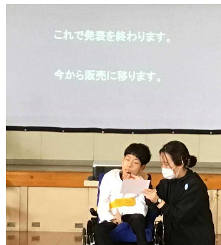
< 生徒会あいさつ >