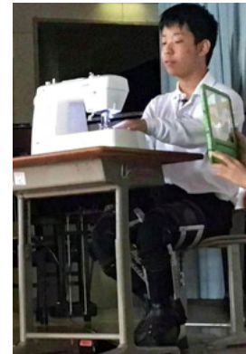
< 縫製 >