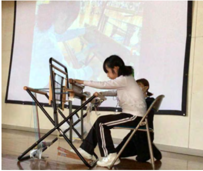
< さをり織り >