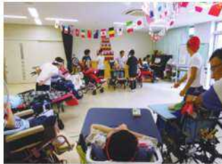
療育活動との交流