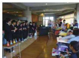
高等養護学校高円分教室との交流及び共同学習