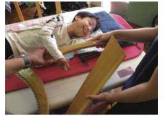
中学部授業「見る聞く」