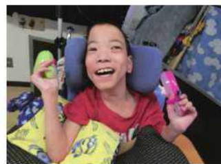
音楽『マラカスを鳴らそう』