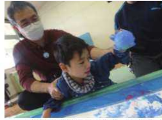
小学部授業「つくる・えかく」