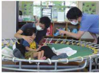
小学部授業「うんどう」