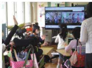
小学部「辰市小学校との交流」