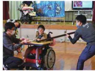
小学部「学習発表会」