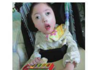
ベッドサイド学習『チャレンジ』