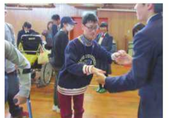
高等部「三校合同交流及び共同学習」