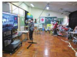
中学部「郡山中学校との交流」