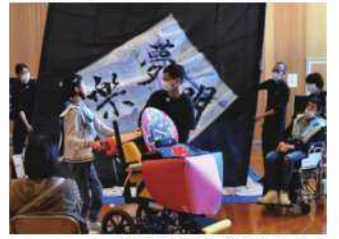
高等部「学習発表会」