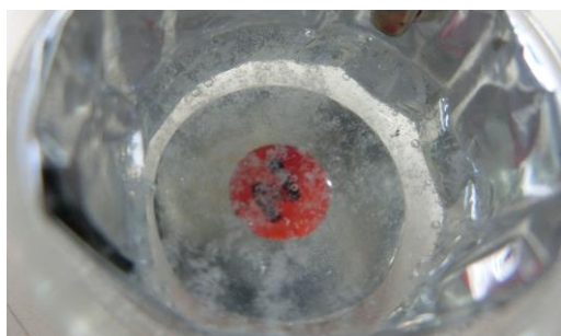
図 3 水溶液中に分散するゲル状白色沈殿 (陽極を撤去した上で撮影)

オンは移動方向に対して水平方向右 90 度にローレンツ力を受け、陰イオンは移動方向に対して水平方向左 90 度にローレンツ力を受けることで、全体として右回転の溶液流を起すものと解釈される。このように、電極材料としてアルミニウムを用い、電解質水溶液として塩化カリウム水溶液を用いることで、安全かつ容易に所望の溶液流が観察される。なお、従来の検討では、ポリスチレン片や炭素粉末を液面に投入して溶液流を観察する手段が提案されてきたが 10), 14) 、今回の新教材では沈殿の動きから溶液流を容易に観察できる。このように、新教材では、現象観察用の浮遊物投入が不要となる点も、簡便性の向上に幾分か寄与する。