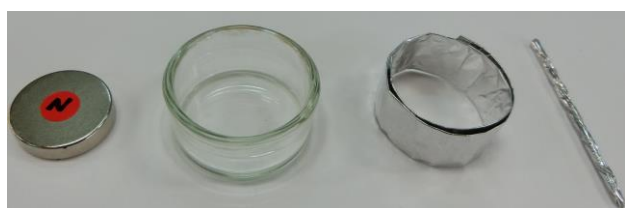
図1 新教材の主要構成部材 (左から磁石、小型容器、環状電極、棒状電極)

以下、ハロゲン化アルカリ水溶液として、塩化カリウム水溶液を用いた場合、あるいは塩化ナトリウム水溶液を用いた場合 15) について述べる。