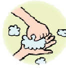
指先と手のひらのしわ