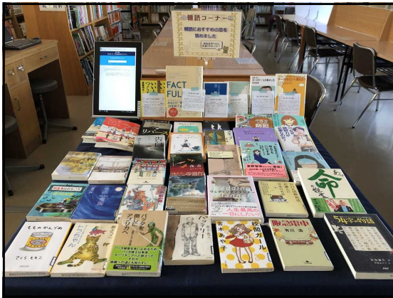
朝読におすすめの本展示