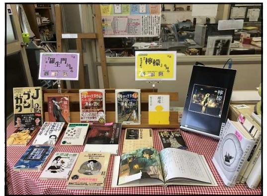
展示【教科とコラボ】 (4/30～5/31)