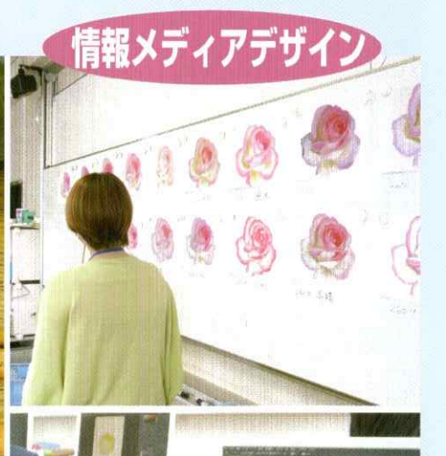
情報メディアデザイン

カトラリーや器など、身近なもののデザイン・制作を通して、機能性・実用性と美しさの関係を探ります。