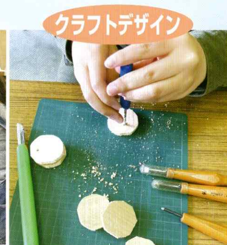
クラフトデザイン

粘土や石膏、木材や発泡ウレタンなど、様々な素材に触れて制作することで、素材への理解や技法の習得を学びます。