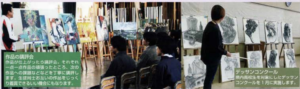
作品の調評会 作品が仕上がったら調評会。それぞれ一点一点作品の頑張ったところ、次の作品への課題などを丁寧に調評します。生徒同士お互いの作品をじっくり鑑賞できるいい機会にもなります。