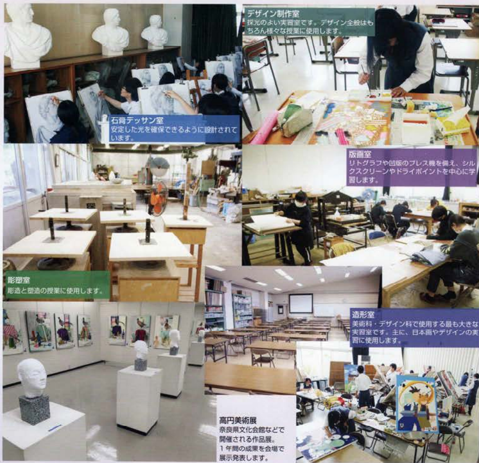
デザイン制作室 採光のよい実習室です。デザイン全般はもちろん様々な授業に使用します。