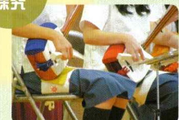
▲伝統芸術探究 三味線