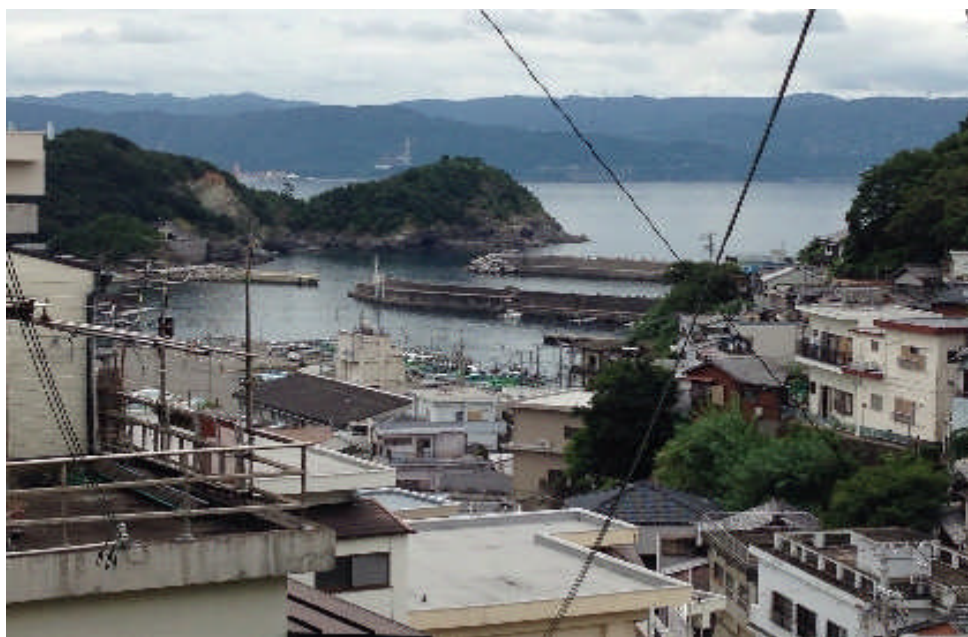
丘の上から望む紀州雑賀崎全景