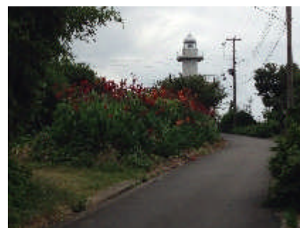
灯台の中でも制作しました