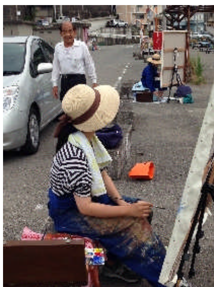
制作中の地元の方とのふれあい