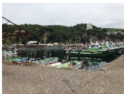
ハモ漁の漁船(上下)