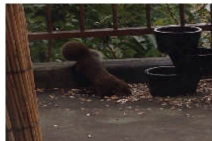
毎朝、現れる野生のリスたち