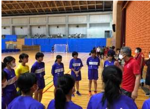
ハーフタイムに監督の指示を聞き、修正して後半に挑みます。