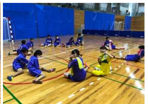
後半も着実に得点し勝利です。いよいよ明日、決勝の舞台に立ちます。