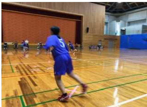
3年生塚本のオフ・ザ・ボール(ボールをもらう前の動き)は秀逸です。ディフェンスからずれたところでプレー出来るので、味方の選手にノーマークチャンスが生まれます。