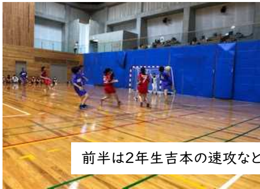
前半は2年生吉本の速攻などで着実に得点し、前半リードです。