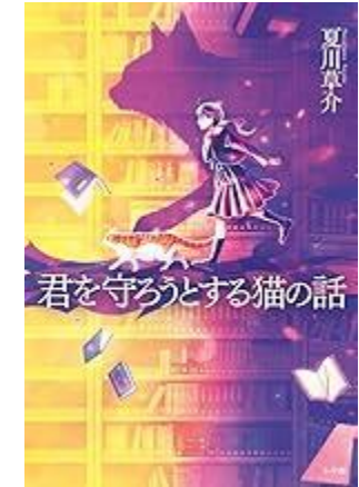
『君を守ろうとする猫の話』 夏川草介著 小学館