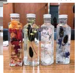
ハーバリウム作製