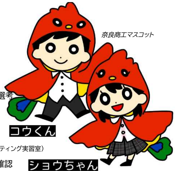
奈良商工マスコット

令和2年11月30日(月) 記念品委員会 (応接室) * 100周年記念スローガン・ロゴマーク選考 * 奈良商工マスコットキャラクター選考 * 記念品の内容検討