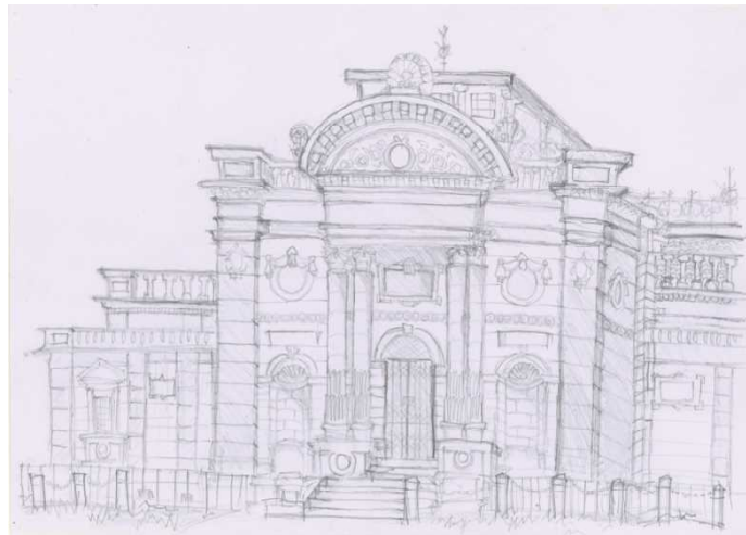
3年生 奈良国立博物館