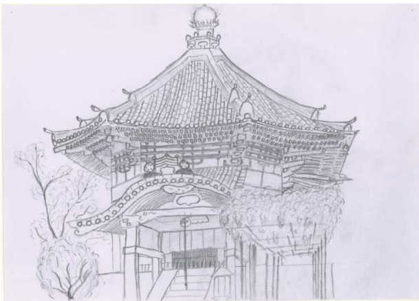
3年生 興福寺(南円堂)