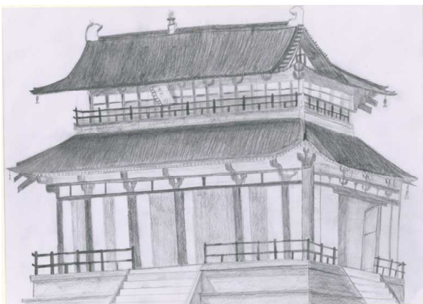
1年生 平城宮跡(大極殿)