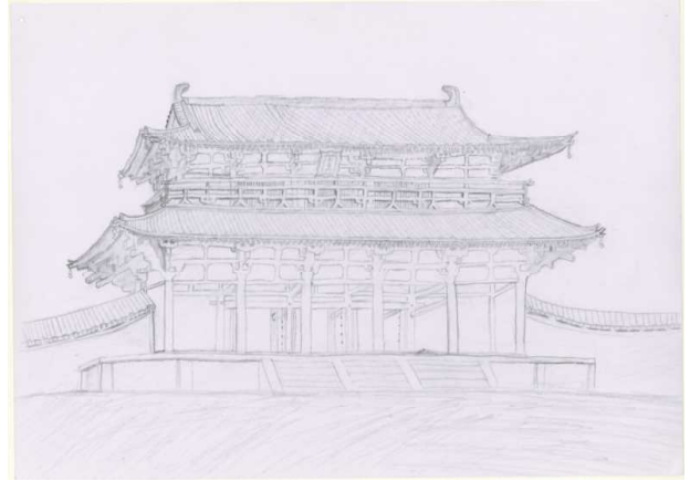
2年生 平城宮跡(朱雀門)