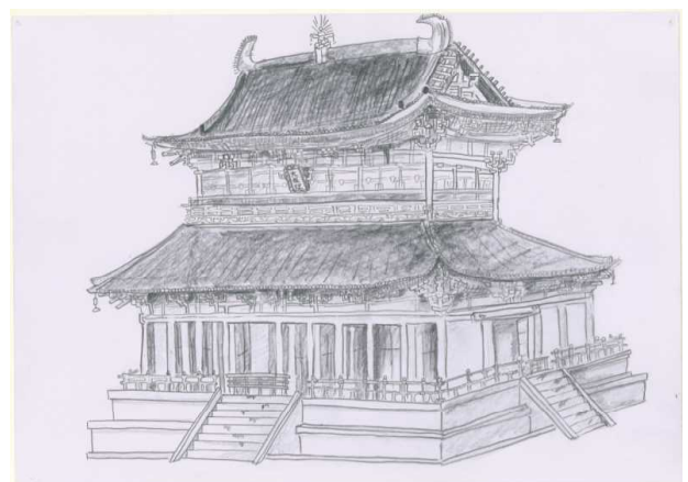
1年生 平城宮跡(大極殿)