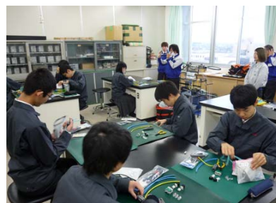
ネットワーク実習