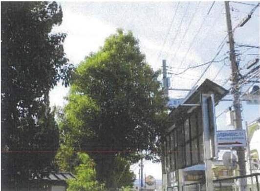
数年前に上を切っている。同じ部分から上を切る