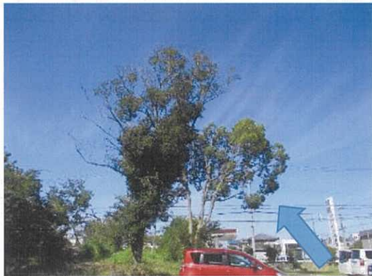
高所作業車で上の枝を切断した後、根元から切る