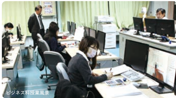
ビジネス科授業風景