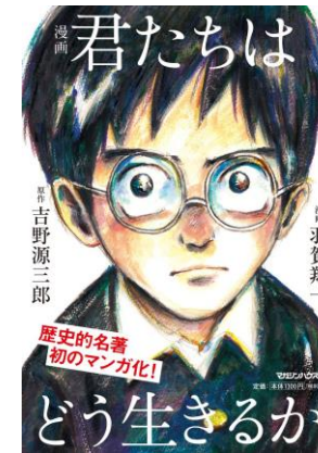
『君たちはどう生きるか』 吉野源三郎原作 羽賀翔一イラスト マガジンハウス