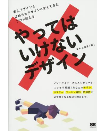
『やってはいけないデザイン』 平本久美子著 翔泳社