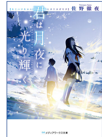
『君は月夜に光り輝く』 佐野徹夜 株式会社 KADOKAWA メディアワークス文庫