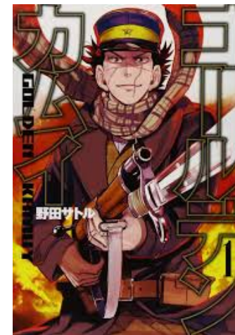
『ゴールデンカムイ 1～16』 ©野田サトル/集英社