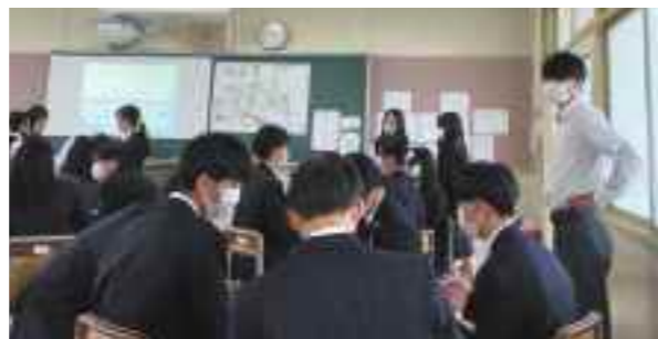
異学年の交流で課題研究を深める