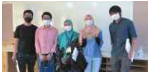
奈良先端科学技術大学院大学生による課題研究支援

高校生国際会議を開催し、国内外の学生・生徒と課題解決に向けた方策などについて、発表・協議をおこないます。また、研究成果を英語・日本語で論文として発表します。