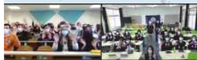
Lytton High School