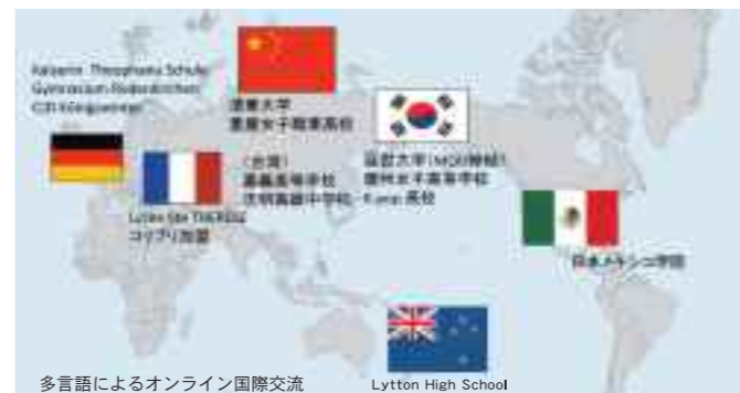
多言語によるオンライン国際交流