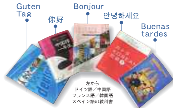
左から ドイツ語/中国語 フランス語/韓国語 スペイン語の教科書

1年次では5つの言語(中国語、韓国語、スペイン語、フランス語、ドイツ語)の基礎と文化を各言語8時間、全員が学びます。2年次では、選択した言語について、担当教員+ネイティブの先生と学びを深めます。希望者は3年次でも継続履修が可能です。