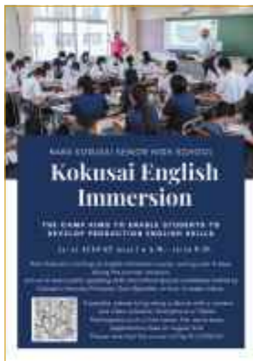
スキルを高める英語セミナー