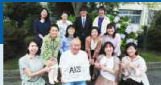
AKS (All Kokusai Support)