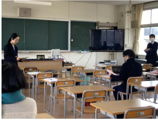
中学合格者説明会の様子