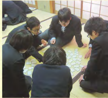
③ 新春百人一首かるた大会