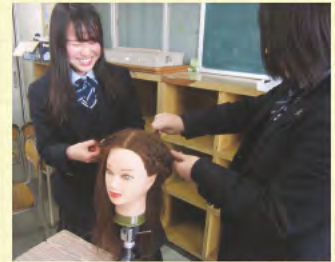
③ ロビンアップゼミ