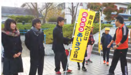
③ ニコニコ挨拶運動(毎月25日実施)