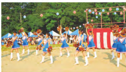
③ 香芝夏祭りへの参加