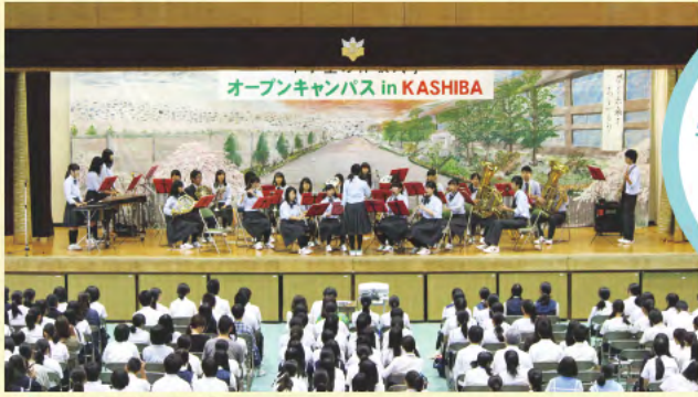
③ オープンキャンパス

オープン キャンパスでは、 学校紹介・部活動紹介・ 部活動見学 などがあります。