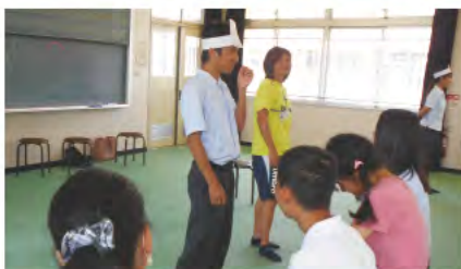
③ 西和養護学校との相互交流