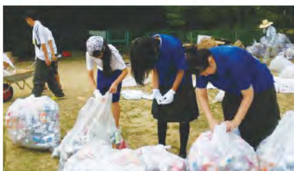
③ 香芝夏祭りの清掃活動