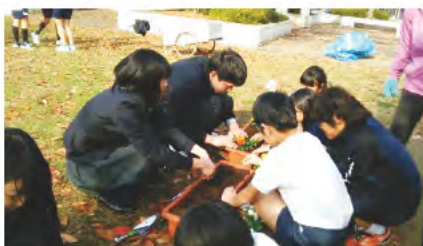
③ 真美ヶ丘西小学校との交流(花いっぱい活動)