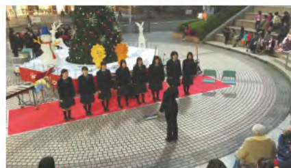
③ 地域のクリスマスツリー点灯式への参加