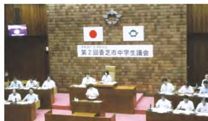
③ 香芝市中学生議会への協力