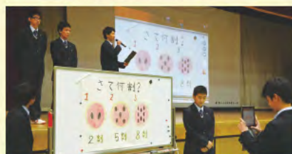
「やまと」プレゼンテーション 優勝グループの発表

1、2年生では奈良TIME「やまと」。郷土の伝統・文化に興味や関心を持ち、語れるよう、フィールドワークやプレゼンテーションを取り入れている。 2、3年生では、進路実現に向けた学習、CQ(キャリアクエスト)を実施。