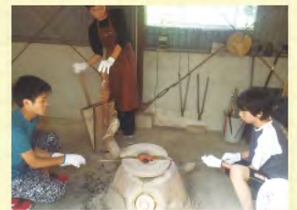
「やまと」フィールドワーク (古代ガラス作り)