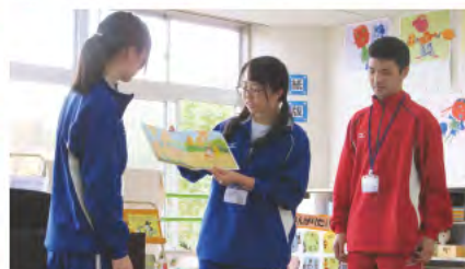
③ 香芝東幼稚園との交流(香芝市教育の日)