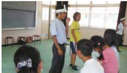
③ 西和養護学校との相互交流