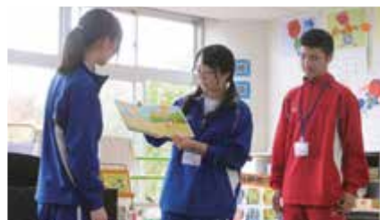
③ 香芝東幼稚園との交流(香芝市教育の日)