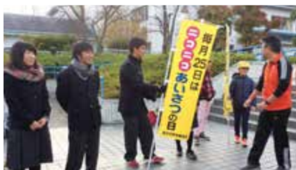
③ ニコニコ挨拶運動(毎月25日実施)