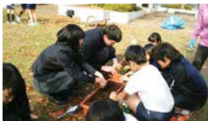
③ 真美ヶ丘西小学校との交流(花いっぱい活動)