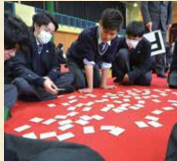
⇒ 新春百人一首かるた大会