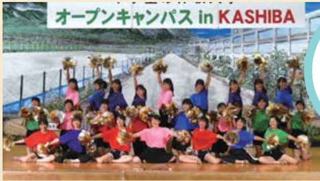
⇒ オープンキャンパス

オープン キャンパスでは、 学校紹介・部活動紹介・ 部活動見学 などがあります。