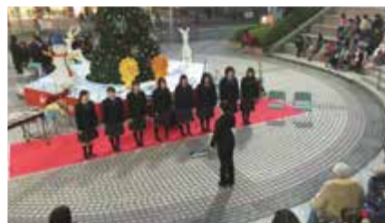
③ 地域のクリスマスツリー点灯式への参加