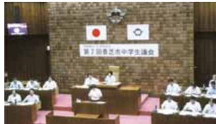
③ 香芝市中学生議会への協力