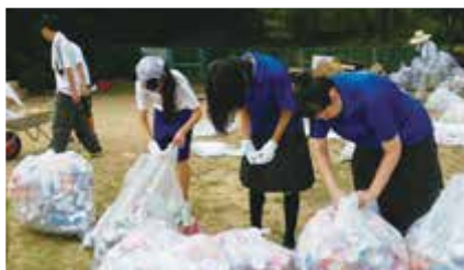
③ 香芝夏祭りの清掃活動