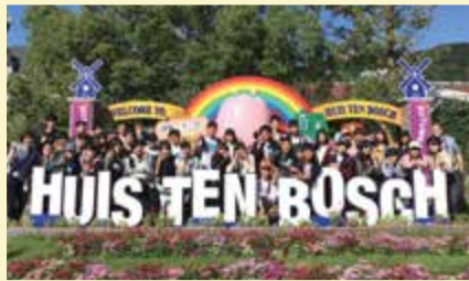
⇒ 修学旅行 (2019年度は長崎・福岡)

球技大会 オープンキャンパス 文化鑑賞会 修学旅行(2年) 校外学習 進路カウンセリング