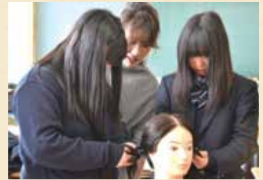
⇒ ロビンアップゼミ