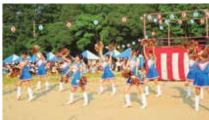
③ 香芝夏祭りへの参加