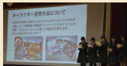
●● 「やまと」プレゼンテーション

1、2年生では奈良TIME「やまと」。郷土の伝統・文化に興味や関心を持ち、語れるよう、フィールドワークやプレゼンテーションを取り入れている。 2、3年生では、進路実現に向けた学習、CQ(キャリアクエスト)を実施。