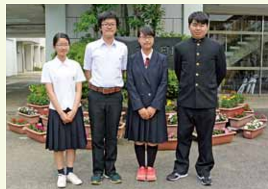
制服 (左が夏用・右が冬用)