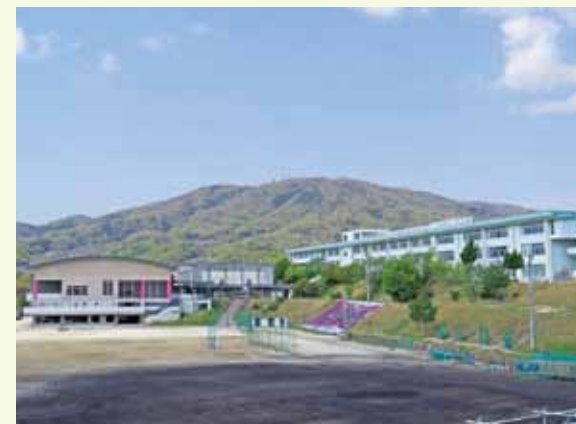
グラウンドから生駒山を眺む