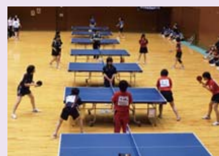
H23年7月、近畿高校卓球大会