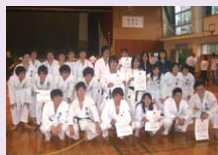
H23年8月、インターハイ(空手道部)