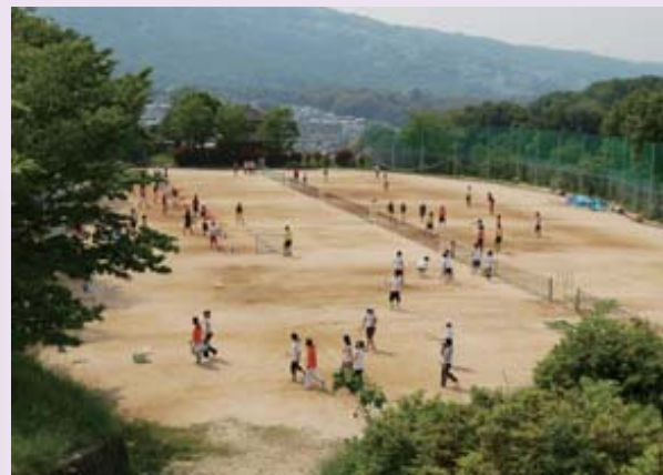
テニスコート 早朝から夕刻まで、若人約1,000人が、鍛練