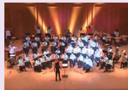
吹奏楽部定期演奏会