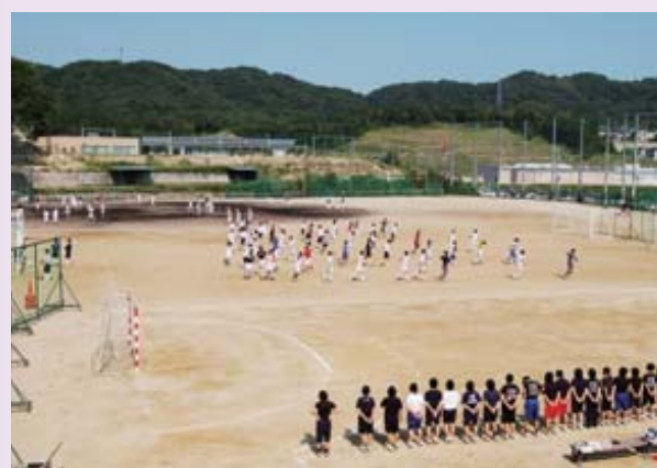
グラウンド かけ声・歓声 グラウンド・体育館等に弾け響く。 「生駒高で、思いっきり!」 輝け、青春の主人公たち。