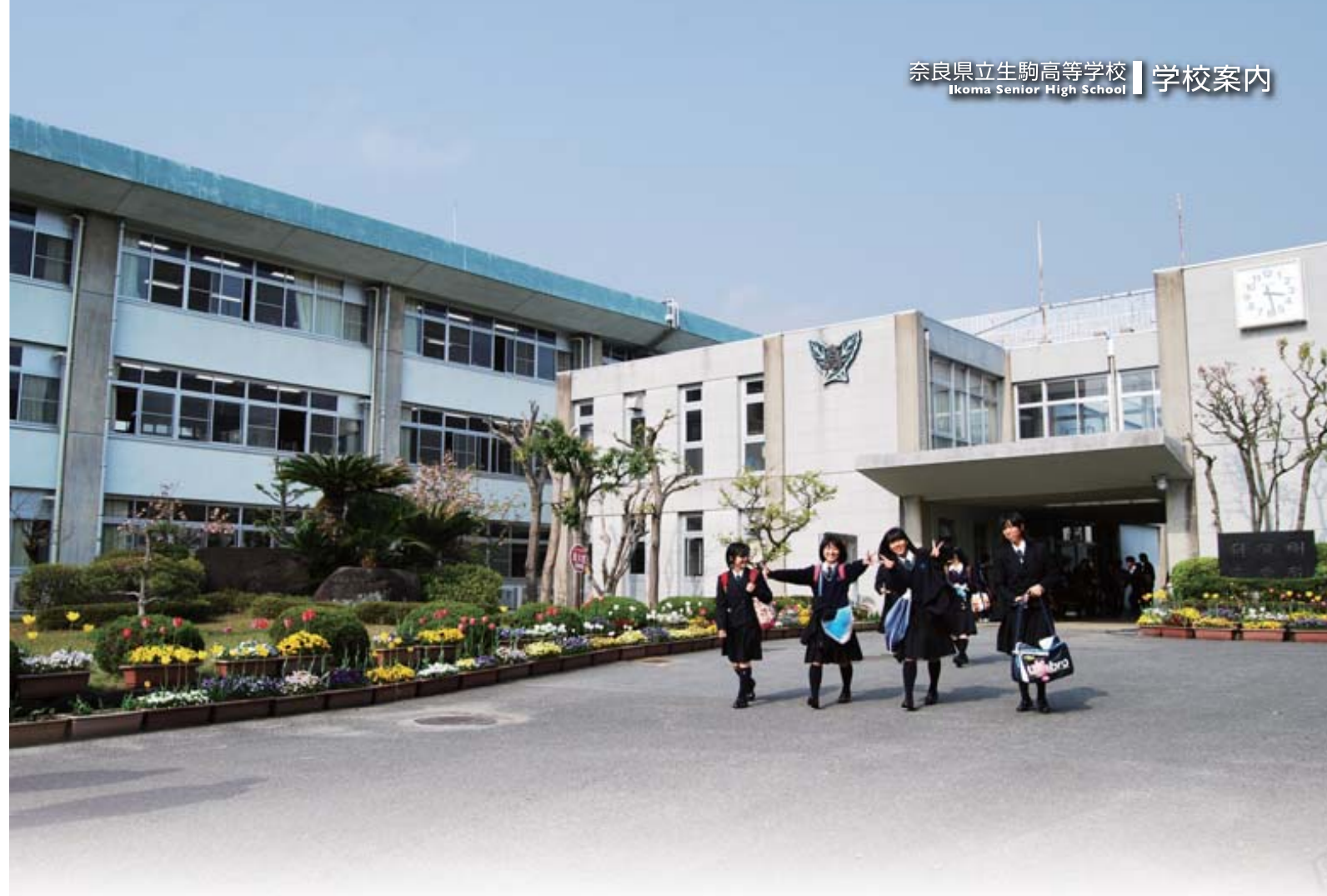
奈良県立生駒高等学校 | 学校案内 Ikoma Senior High School | School Guide