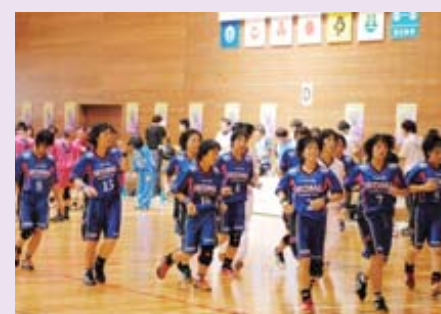
H23年8月、インターハイ(ハンドボール部)